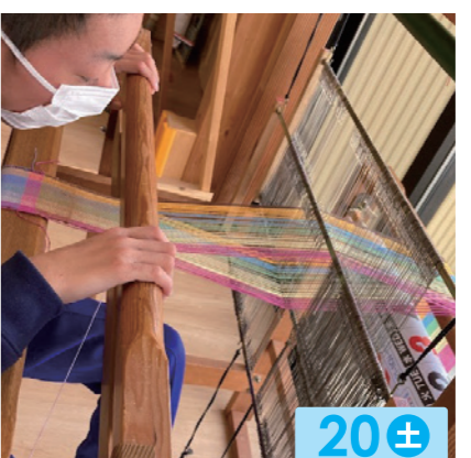
NPO 法人いろどり 20± さをり織り。