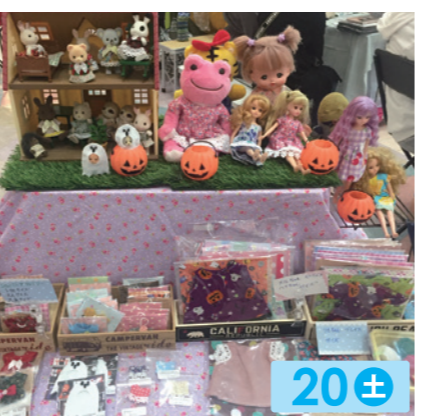
KUPUMOANA 20± リカちゃん、メルちゃん、シルバニアのお洋服やぬいぐるみ。