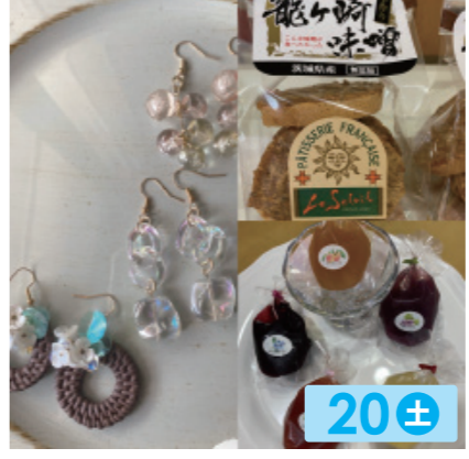
Kuu & Le Soleil 20± 押し花と手染めビーズのアクセサリー。ラスクやゼリーも。