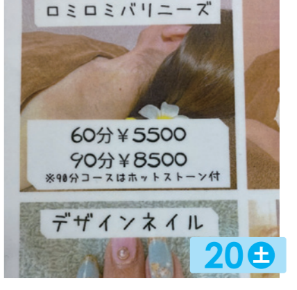
puluchu 20± ネイル、マッサージ。