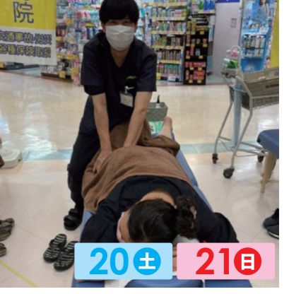
松本接骨院グループ 20± 21日 ワンコインマッサージ、ストレッチ。