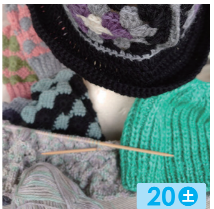
糸あそび 20± ニット小物。