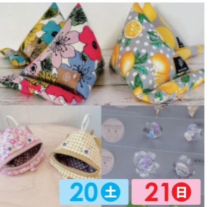
ichigo 20± 21日 便利でかわいい布小物&アクセサリーを制作しております。