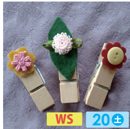
おばこちゃんち WS 20± 和の布を使った小物や刺し子の小物を制作しています。