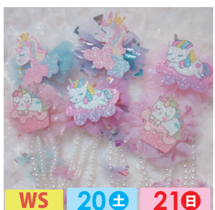
jelly beans WS 20± 21日 キッズヘアアクセサリー・布小物。