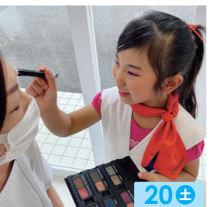
POLA 龍ヶ崎ニュータウン 20± ひんやりリスキリハンドトリートメント・キッズお仕事体験。