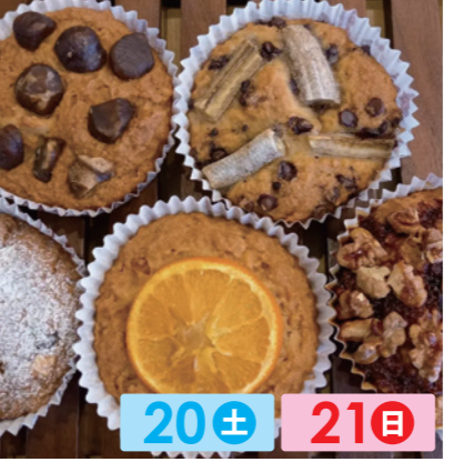
街かどのぼん屋 20± 21日 もみの木 地産食材をフレーバーにしたカップケーキのような蒸しパン。