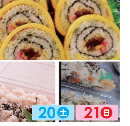
大野食品 20± 21日 卵巻き寿司、いなり寿司、山菜おこわ、赤飯