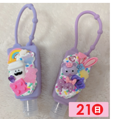
Smiley Q'nt 21日 キッズ向けヘアアクセサリー。