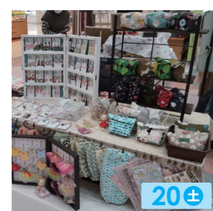
ハンドメイドことり 20± かえるのピクレスやメルちゃんソランちゃんの人形販売