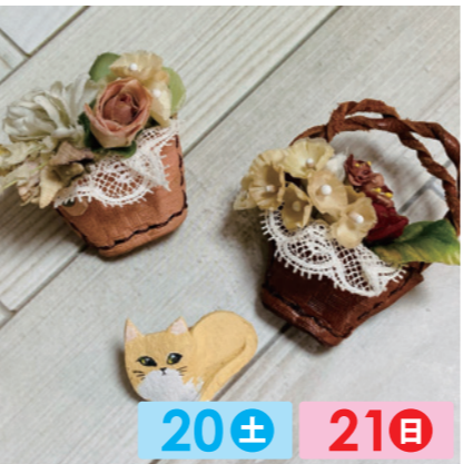
T & Aria 20± 21日 革などを使ったブローチや、小さなアクセサリーの販売。