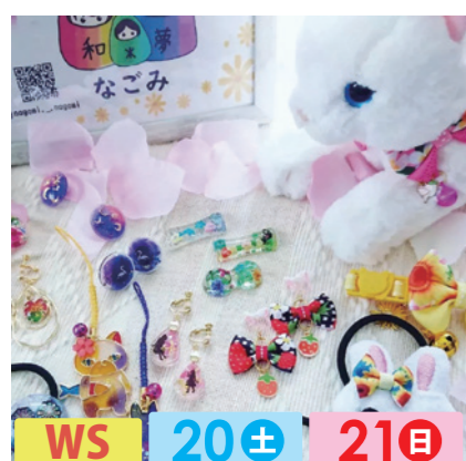
和*夢 WS 20± 21日 ハンドメイドアクセサリー、猫の首輪など作成しています。