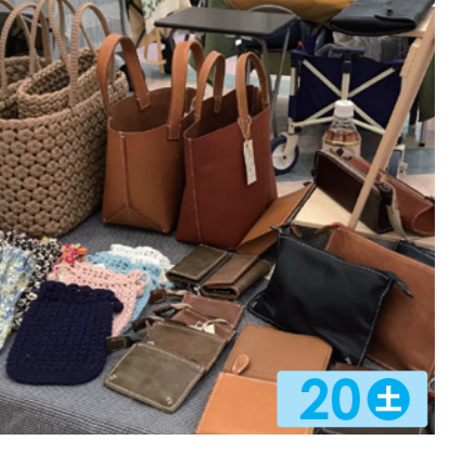
Sobakasu Bu 20± 革小物、エプロン布小物。