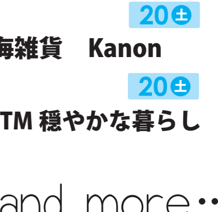
海雑貨 Kanon 20± STM 穏やかな暮らし and more...