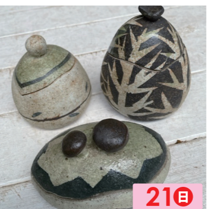
y's工房 21日 ひとつひとつ楽しみながら作った陶の作品です。