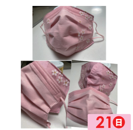
希希 3 21日 マスクを始め小物やバック。入園グッズ。