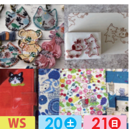
komono mania&六花堂 WS 20± 21日 スマホケースやオリジナルデザインはんこの販売。