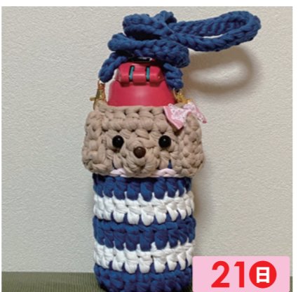
フルール 21日 リサイクルヤーン雑貨。