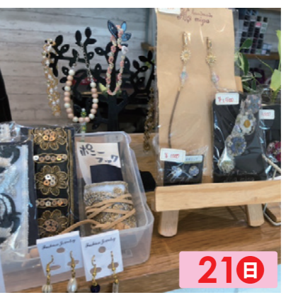
MikaMi 21日 作家数名で自分の好きなモノを気まぐれで作っています！