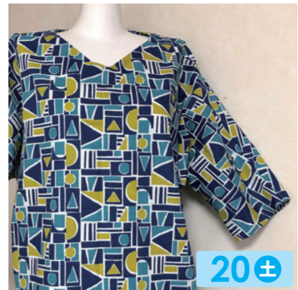
弥栄 いやさか 20± 布を使ってバッグやポーチ・洋服、着物や帯のリメイク。