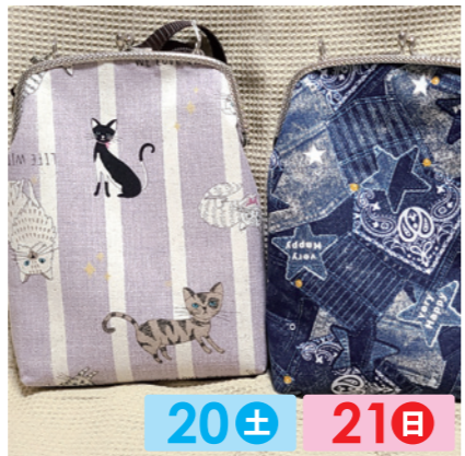
SORA 20± 21日 布小物、がま口、レジンアクセサリーを作っています。