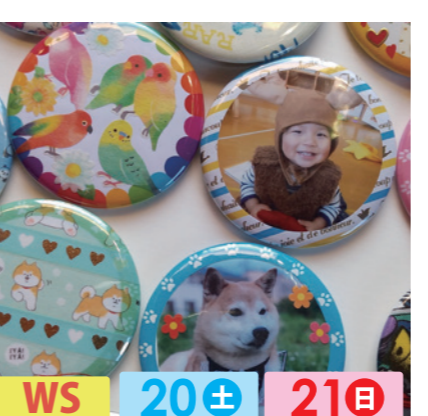
こぶぐの缶バッヂ屋 WS 20± 21日 まいりゅうグッズの販売。