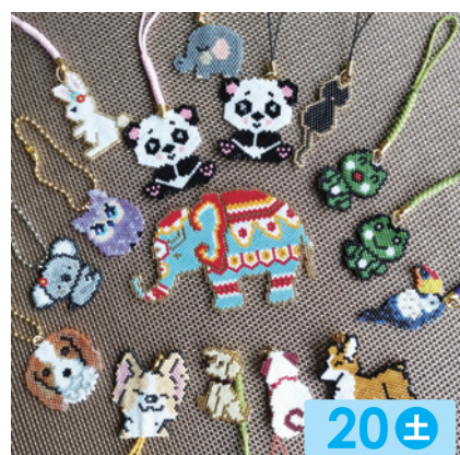
メイ&ルイ 20± ストラップ、マスクチャーム等新しい作品が出来ました。