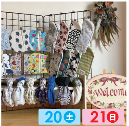
raubritter60 20± 21日 布小物、クラフトバンドでバッグやかごを作っています。