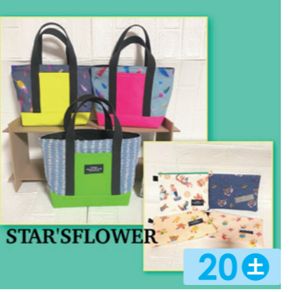
star's flower 20± 布小物・バッグやポーチ巾着。