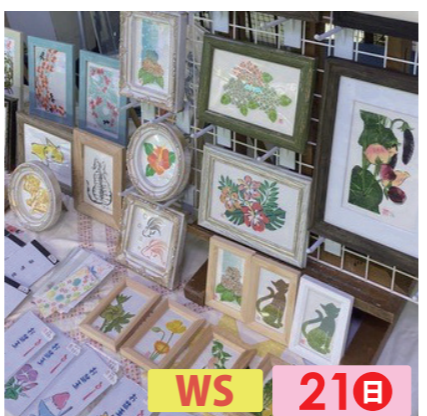
孔版-KURO WS 21日 孔版画で制作した商品(ポストカード、コースター、雑記帳、他)。