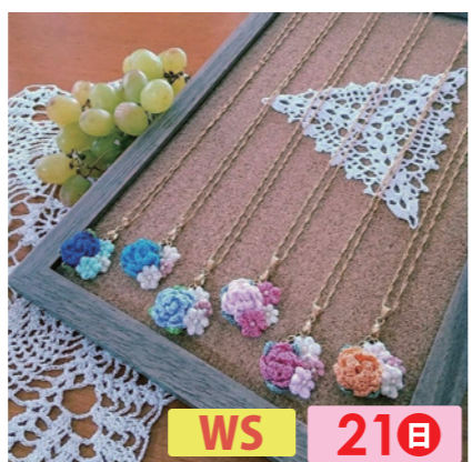
ぶちらく WS 21日 編み物、羊毛フェルトなど手作り雑貨・アクセサリーの販売。