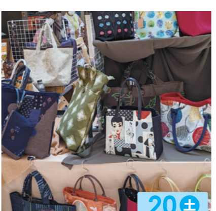
和(なごみ) 20± 和風リメイク、帯、バッグ他。