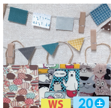
SORA WS 20± はぎれを使った布小物と、小さなぬいぐるみを作っております。