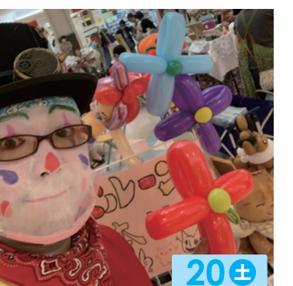
風船ピエロ 20± バルーンアート。1本100円〜。