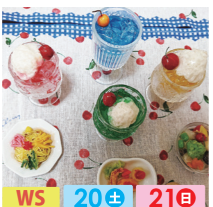
ちえりこ WS 20± 21日 粘土で作った食品サンプルやキーホルダー、マグネット。