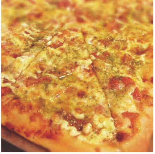
トマトパズルピザ、 揚げたてカレーパン