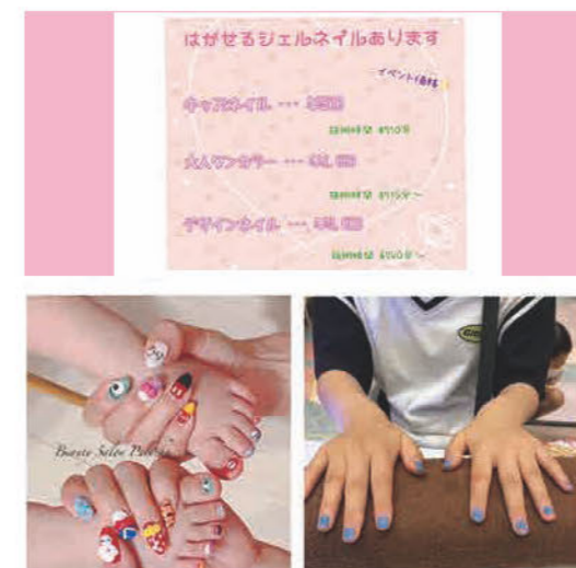
ジェルネイル体験