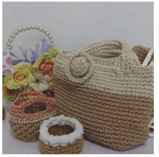
帯や麻紐を使ってバッグや小物を 作っています