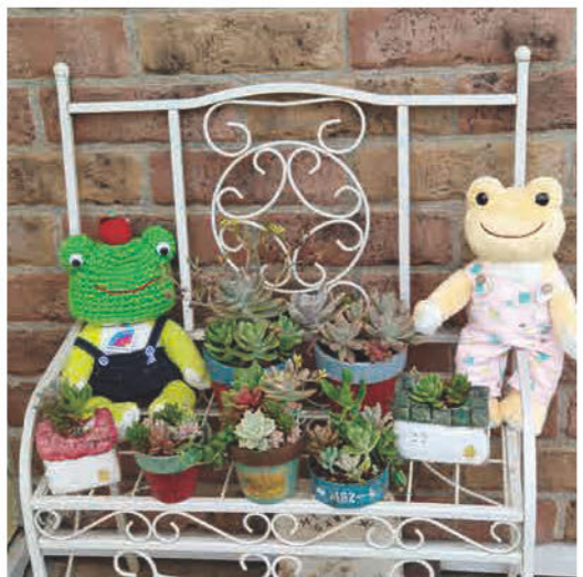
多肉植物寄せ植え・リメイク鉢・ かえるのピクルス・メルちゃん販売