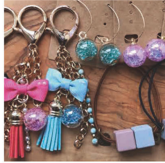
ピアス、イヤリング、ヘアゴム、 キーホルダー、アレスレットなどの アクセサリー