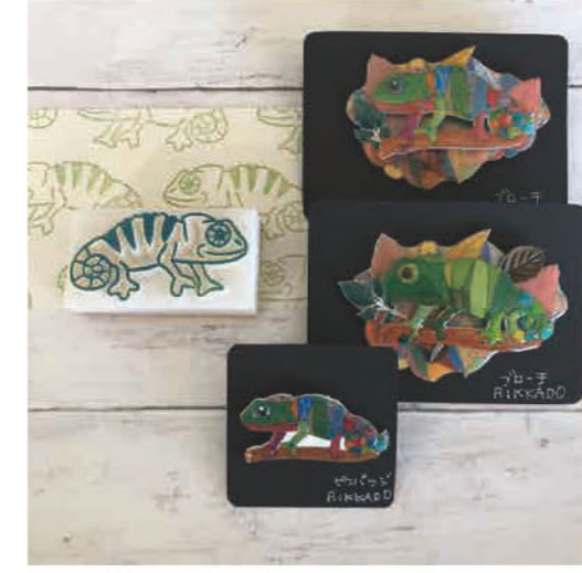
全てオリジナルデザインでひとつ ひとつ手彫りしています はんこの デザインを活かしてアクセサリーも 作っています。お名前はんこの実 演販売も行います。