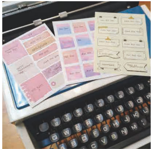
消しゴムはんこ文具のハンドメイド ★WS/ 昔懐かしいタイプライターを 使ってオリジナルシールを作りましょう