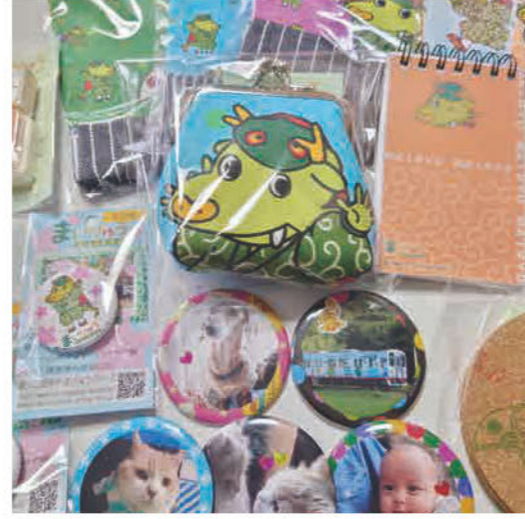
缶バッヂづくりのワークショップと まいりゅうグッズの販売を行います ★WS/ 絵を描いたりシールを貼っ たりして世界でひとつオリジナル缶 バッヂを作ります。スマホの写真か ら作る事も出来ます