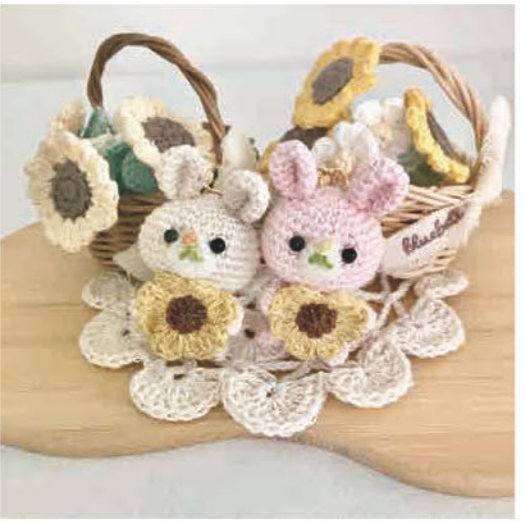
かぎ編みアクセサリー、あみぐるみ