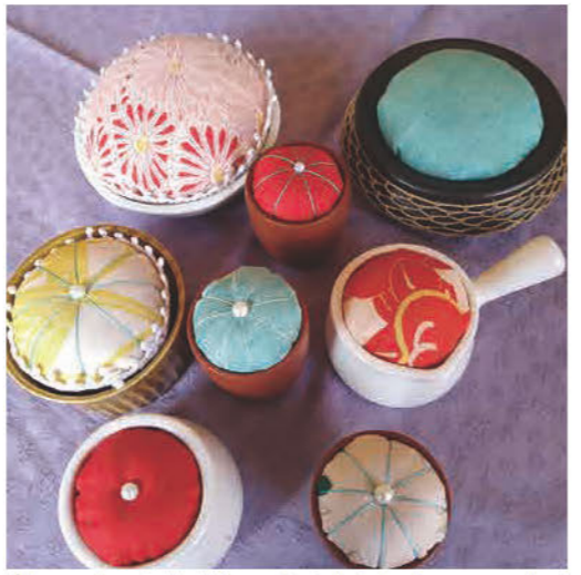
気の向くままに日々制作しています