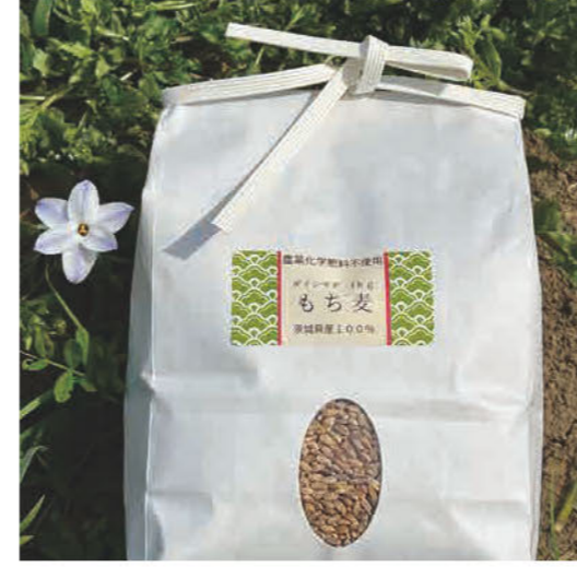
無農薬、無化学肥料、えごま油、 もち麦