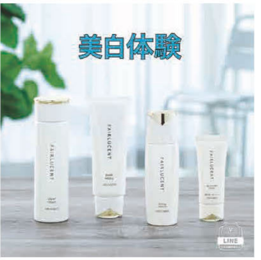
美白体験 美白体験・メイクシュミレーター メイク体験