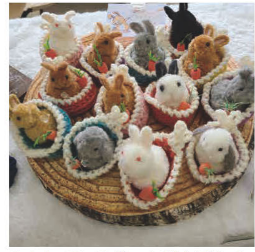
毛糸をくるくる巻いたぼんぼんで うさぎを作っています