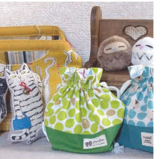
はぎれを使った布小物と、 小さなぬいぐるみを作っています