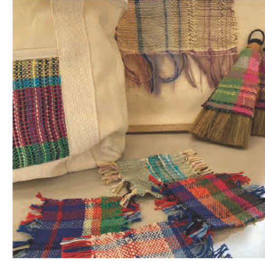
障がい者の通所施設にて、利用者 さんの制作した“さりを織り”を 使用した商品を販売いたしております ★WS/ さりを織り機の実体験