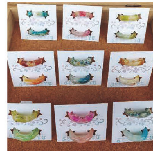
編み小物、羊毛フェルト、 ビーズ・レジンアクセサリー、布小物 ★WS/ アロマスプレー & バスソルト作り