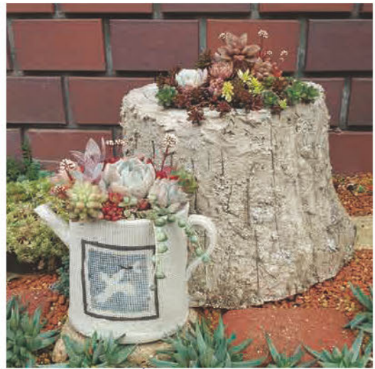
多肉植物の寄せ植え 苗の販売