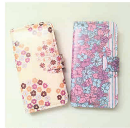
可愛い柄の多機種対応 手帳型スマホケース