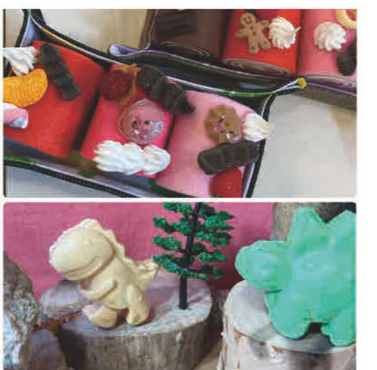
★WS/ フェルトロールケーキデコと 恐竜のすみかを作ろう