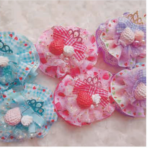
女の子の『オシャレしたい!』 気持ちを応援するヘアアクセサリー