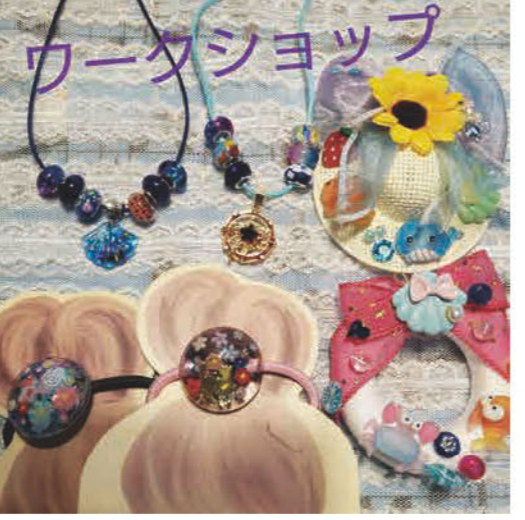
レジンアクセサリー ★WS/ レジンアヘアゴム、 夏のミニリース、ビーズアクセサリー