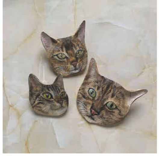
革でブローチなどの小さな物を作っています