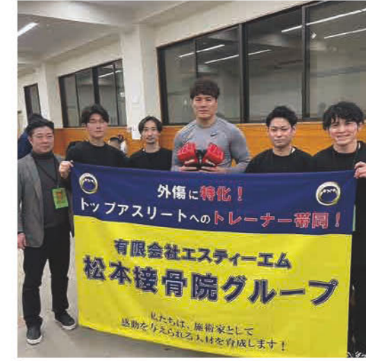
ワンコインマッサージ&ストレッチ