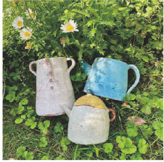
ひとつひとつ心を込めて作った 陶芸作品