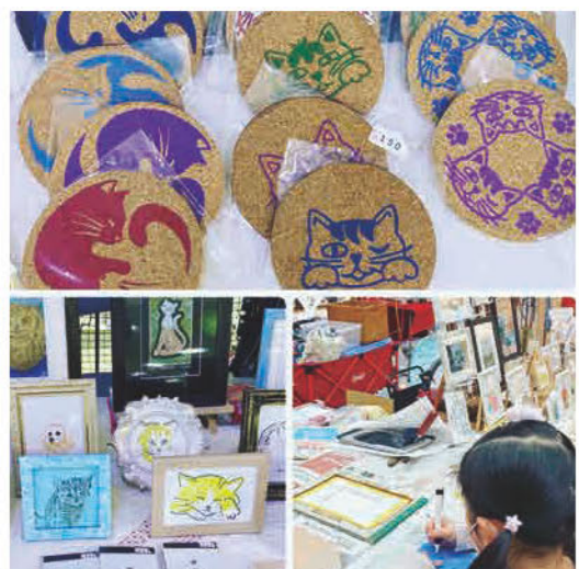
孔版画で制作したポストカード、 コースターなどの販売 ★WS/ オリジナル名刺、 ショップカードの作成