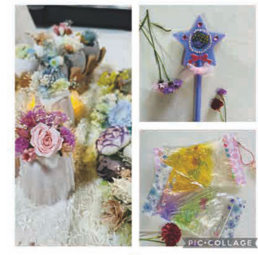
キャンドル、雑貨、など ★WS/ キラキラストピック作り・ スライムでぶにぶにストラップ作り