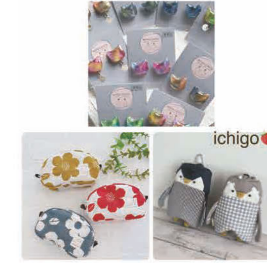
便利で大人かわいい布小物 & アクセ サリーを制作しております ぜひご覧ください☆