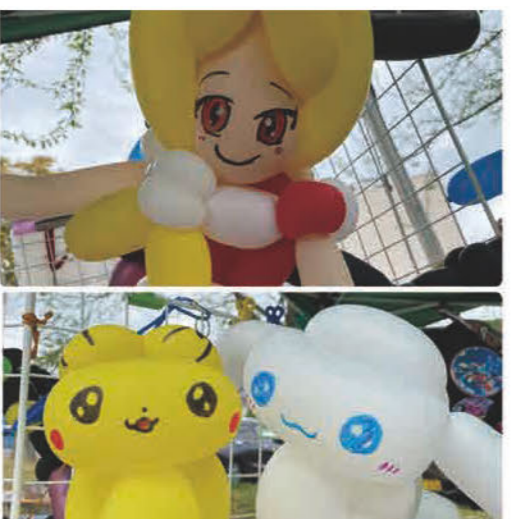
バルーン 1本 100円から好きな キャラクター作ります