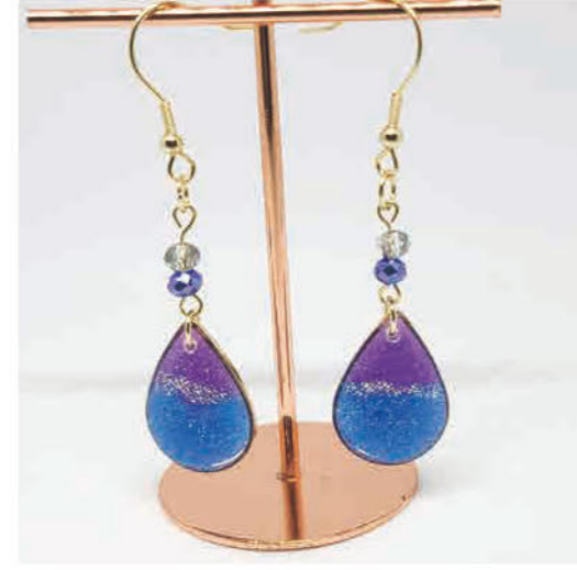
レジンアクセサリー、 がま口を作っています