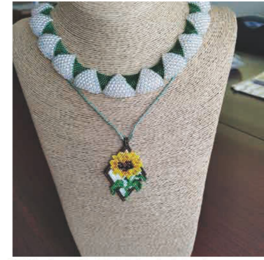
夏向きの作品が出来ました