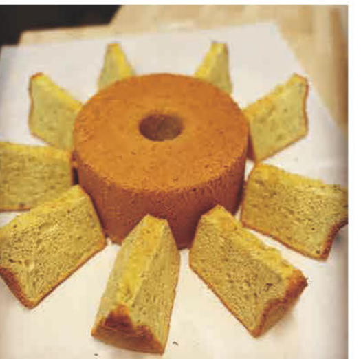
シフォンケーキや焼き菓子