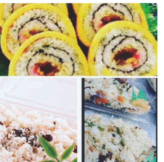
赤飯、山菜おこわなどをご用意します 元祖人気のたまご巻きはイベントの みで販売です