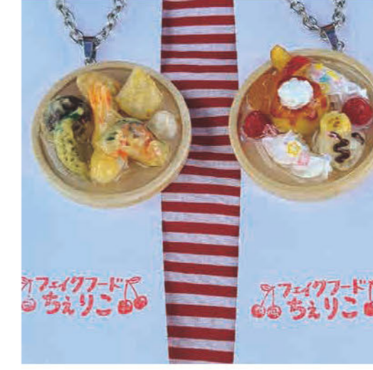
樹脂粘土でフェイクフードを作っ ています ★WS/ フェイクフードのキーホルダー とマグネット作り