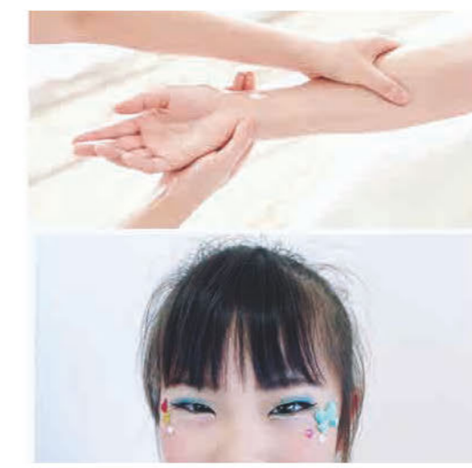
キッズメイク・ハンドトリートメント