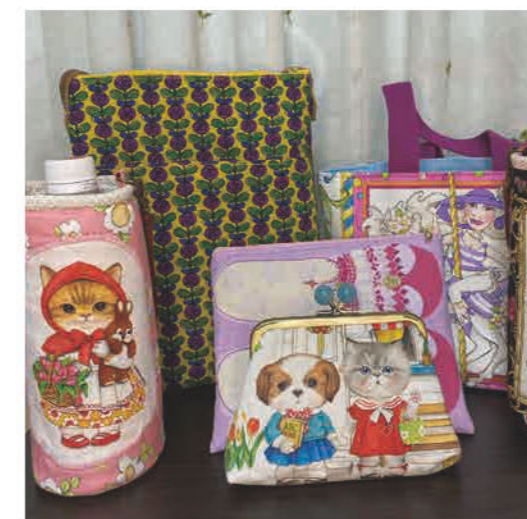
持っているだけでウキウキするような、 大人でも持てる大人可愛い小物を 目指して作っています