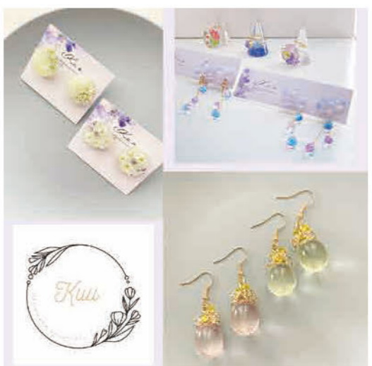
手染めビーズとレジンでアクセサリー を制作しています レジンの中のドラ イフワワーは庭で咲いたものをメイン に封入しています