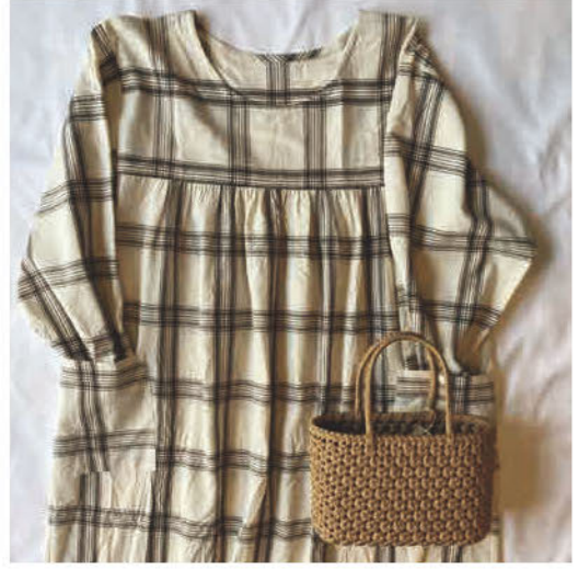
割烹着 エプロン 革小物 花編みのカゴバッグ