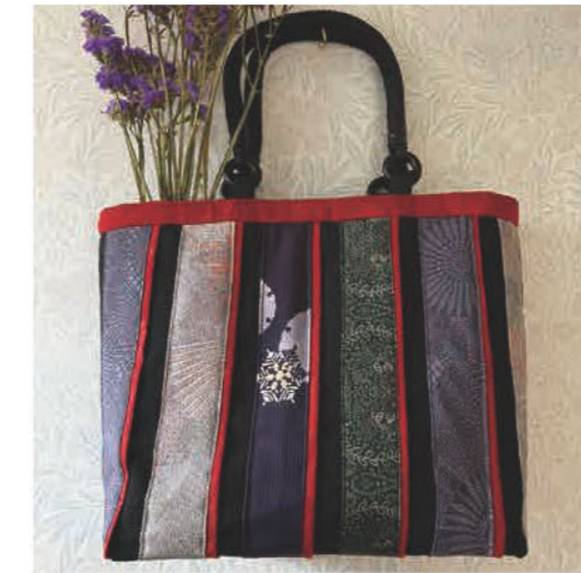
和風リメイク、帯バッグ他