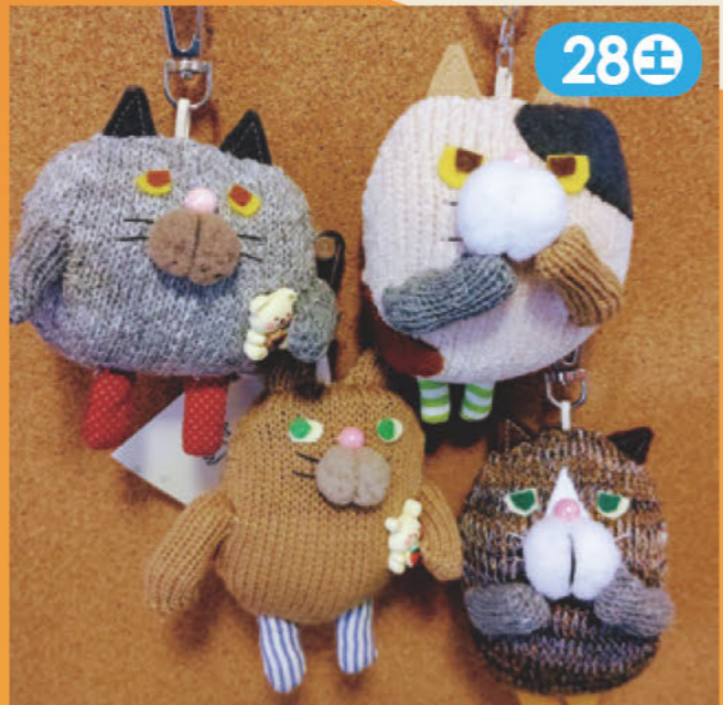
ハンドメイドぬいぐるみ、布小物