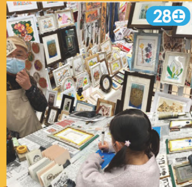
孔版画で制作した商品