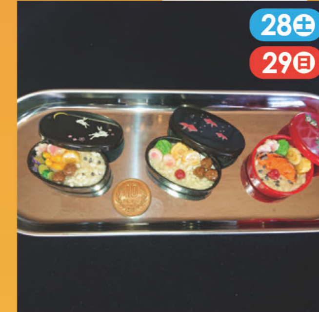
樹脂粘土で作った小さなフェイクフード