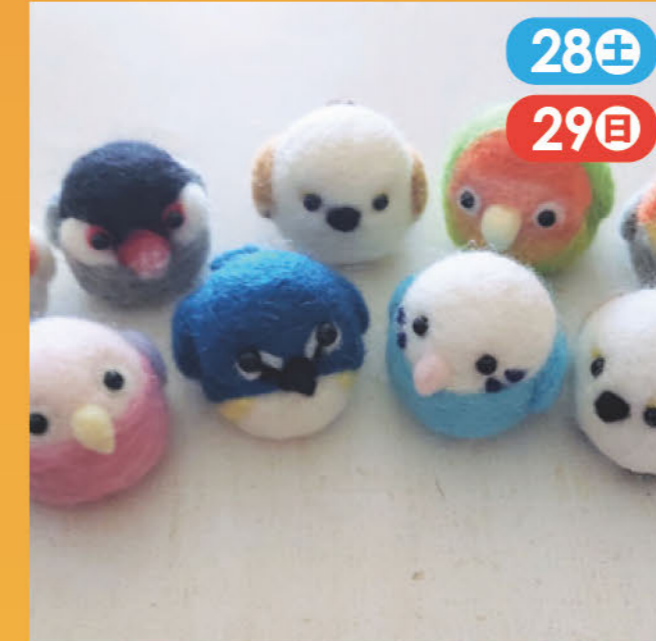
編み小物、布小物、羊毛フェルト、レジン・ビーズアクセサリーなど