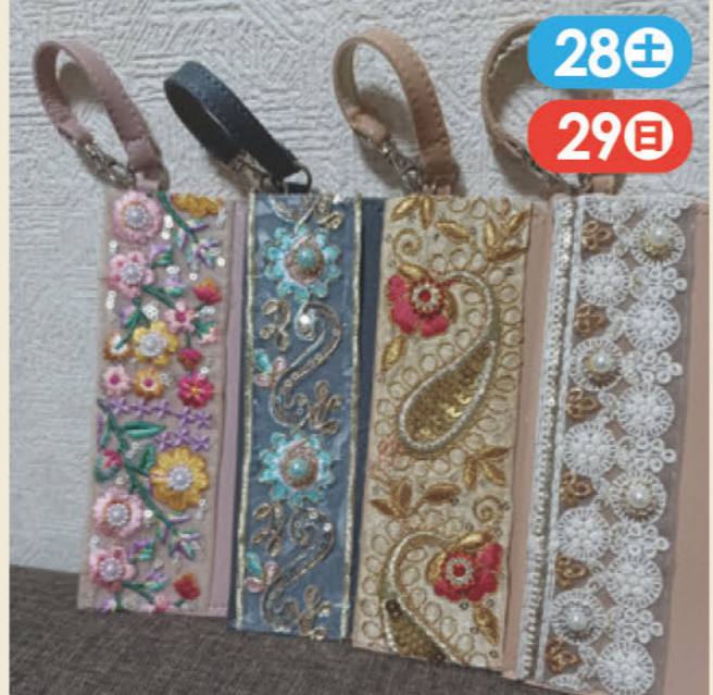
カバンにもつけられるメガネケース