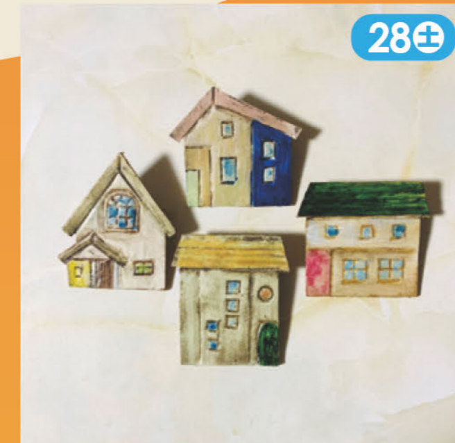
革でブローチなど