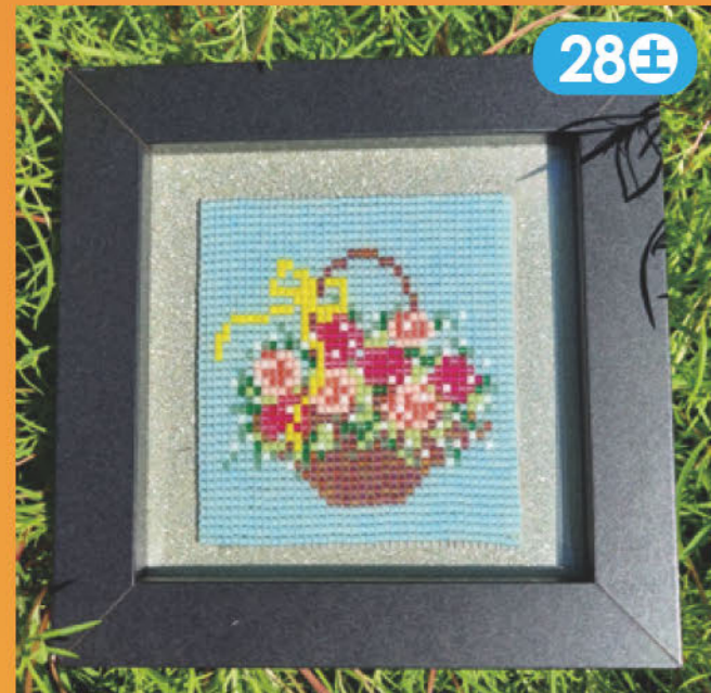
お部屋のちょっとした所に飾る額