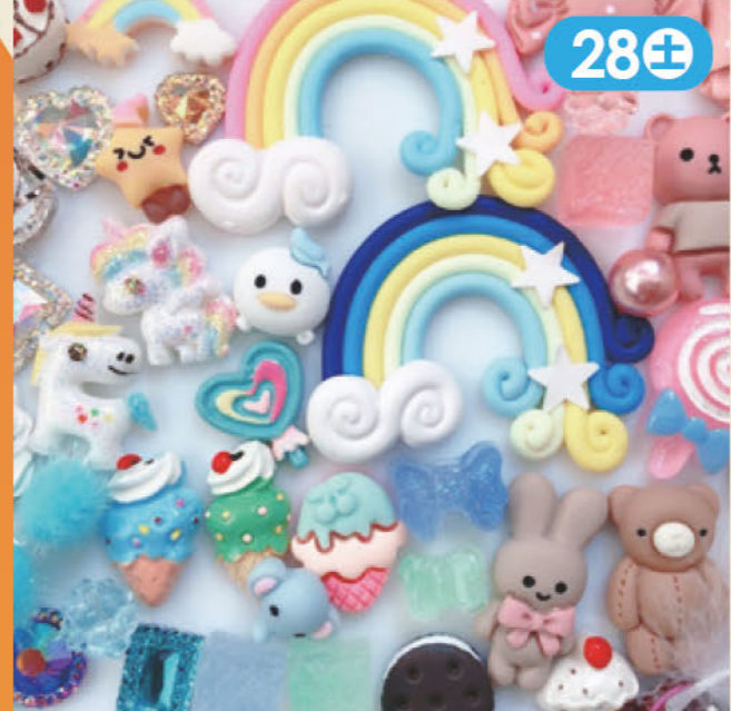
可愛いデコパーツを使った作品販売