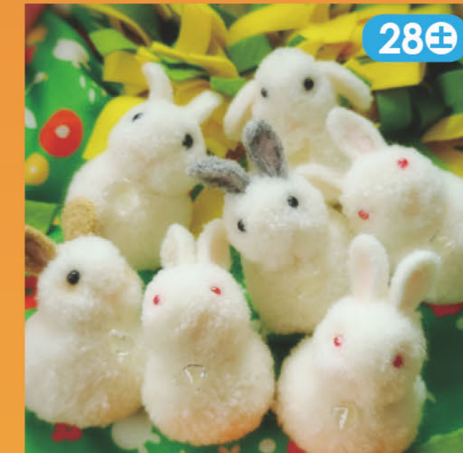
毛糸をくるくる巻いたぼんぼんのうさぎ