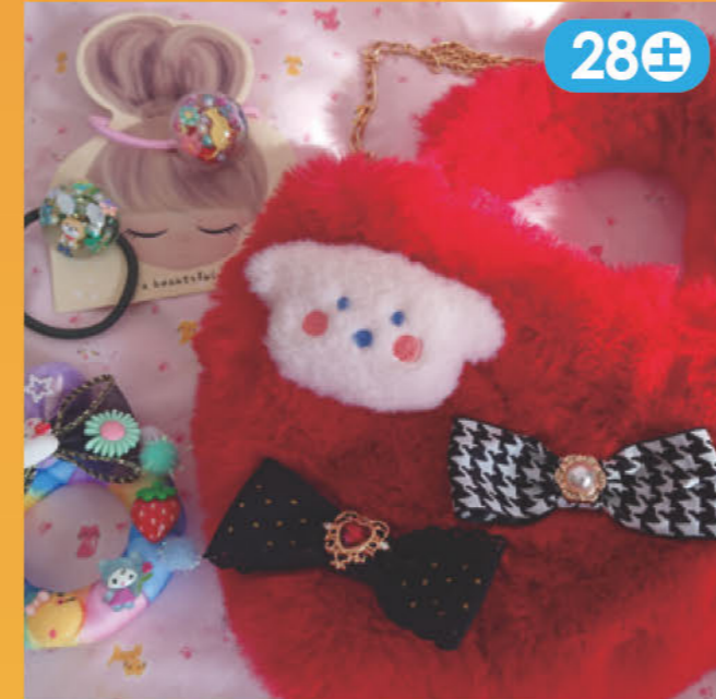
キッズアクセサリーを中心にリボン、レジンアクセサリーの販売