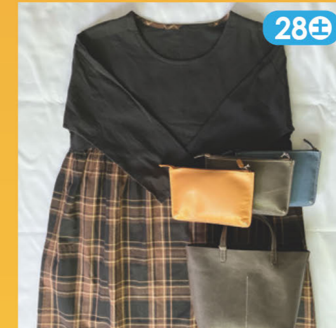
割烹着・エプロン・大人服・革小物