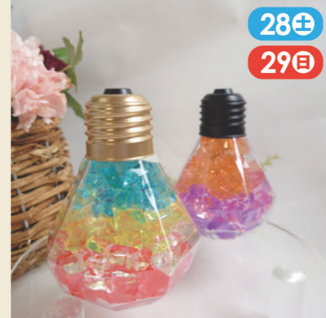
アクセサリーから小物雑貨まで、ハンドメイドしています