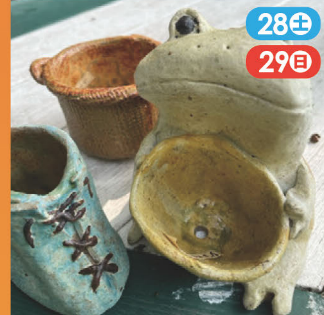
心を込めて、楽しみながら作った陶芸作品