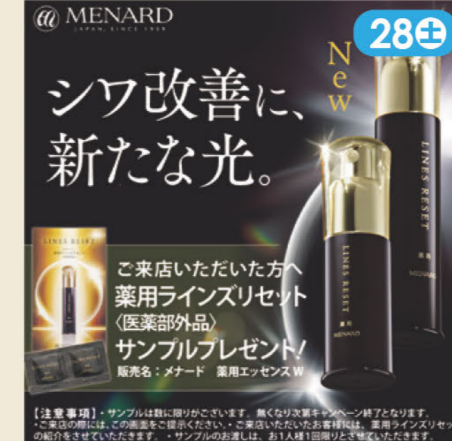
新商品シワ改善美容液体験・秋のメイク体験