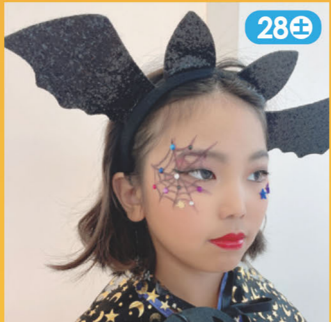
ハロウィンメイク