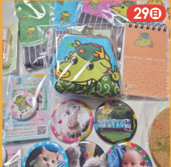
缶バッヂづくりのワークショップとまじりゅうグッズの販売