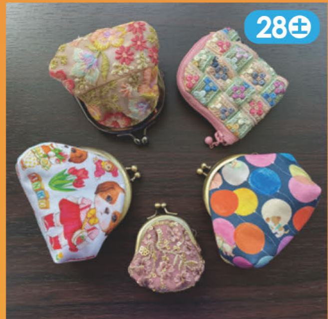
可愛い小さながま口