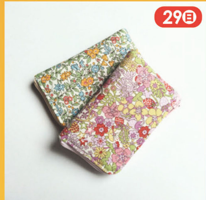
多機種対応手帳型スマホケース