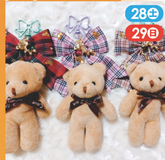
キッズヘアアクセサリー・布小物