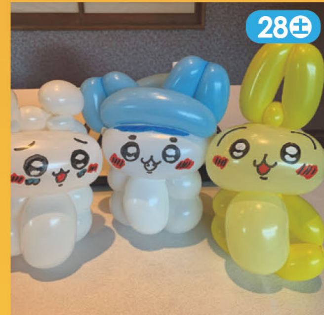
バルーンアートの販売