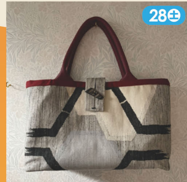
和風リメーク・帯バッグ・着物ブラウス