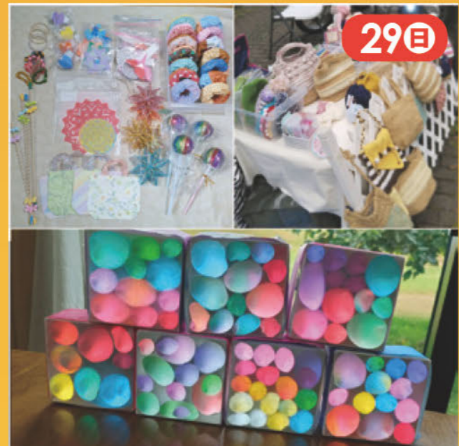
親子で楽しめる、編み小物から手作りおもちゃ