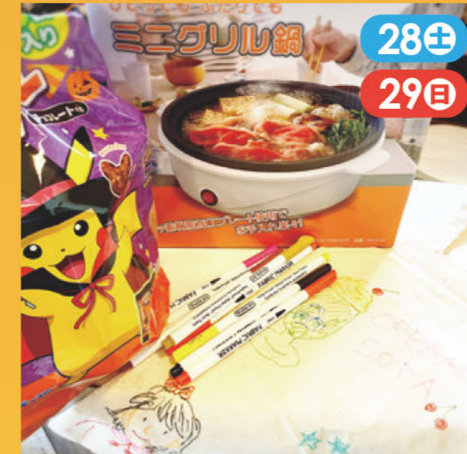
お絵描きトートバッグワークショップ・抽選会