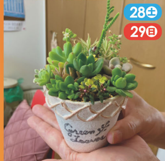
多肉植物の苗と寄せ植え