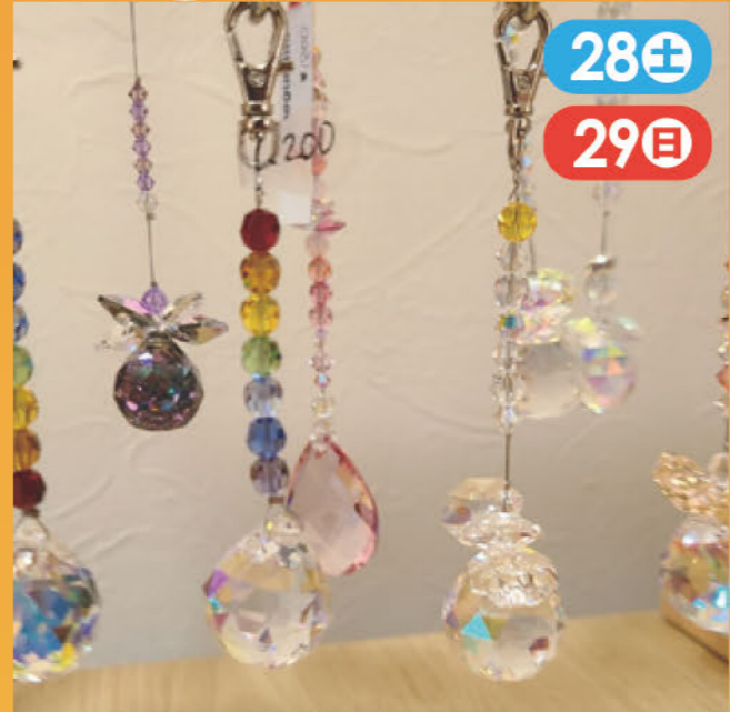
スワロフスキーなどクリスタルを使ってサンキャッチャーやアクセサリー