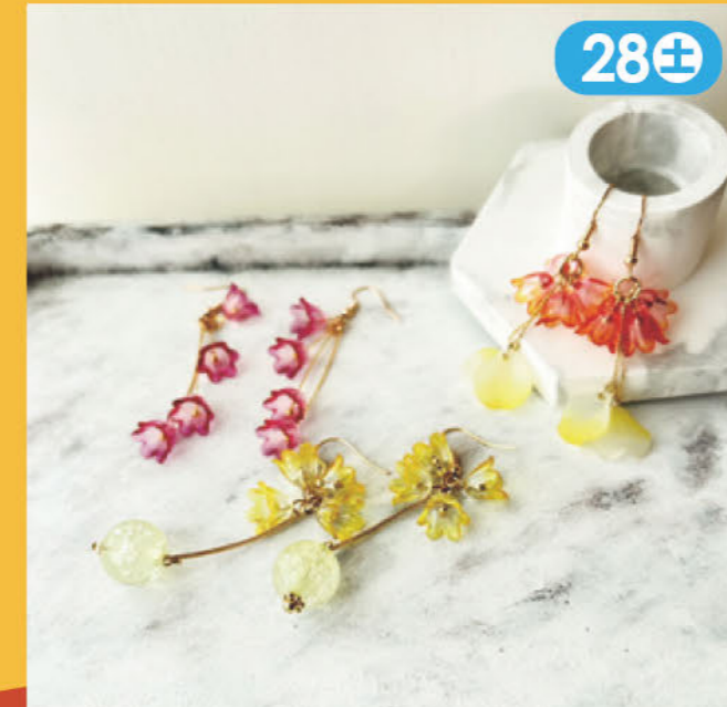
手染めビーズとレジンでアクセサリー商品