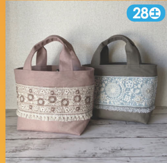
インド刺繍リボンの布小物