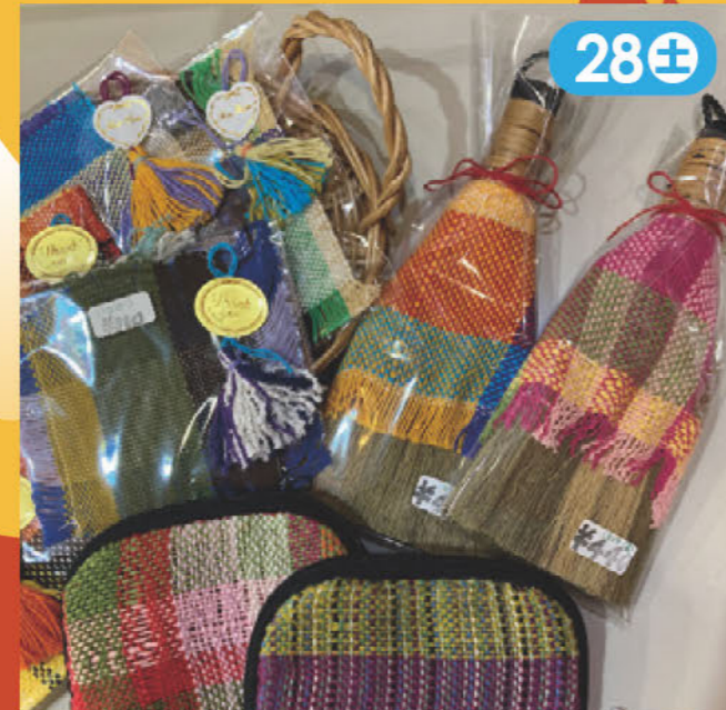
“きりぎりす”を使用した商品