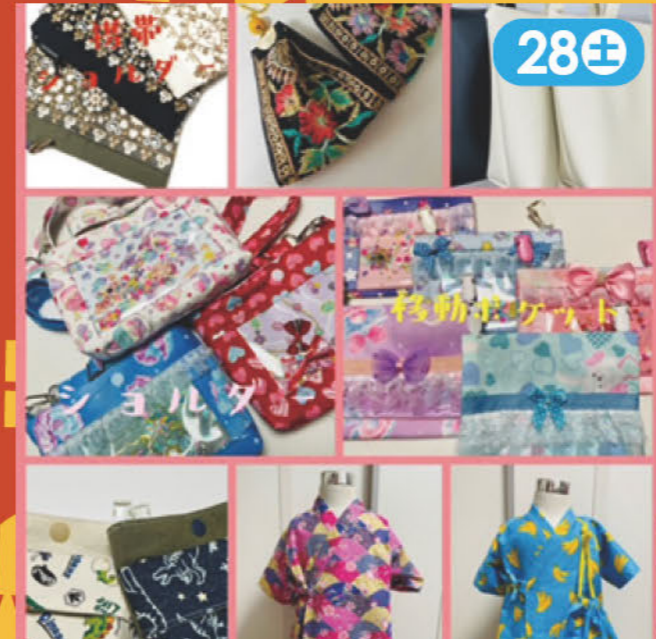
携帯ポシェットコインスロー